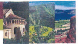
St Guilhem-le-désert Gorges de l'Hérault Lac du Salagou et Cirque de Mour Cirque de Navacel Grands Sib