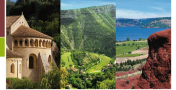
St Guilhem-le-désert Gorges de l'Hérault Lac du Salagou et Cirque de Mourèze Cirque de Navacelles Grands Sites

A l'attention des Délégués (ées) du SYDEL Pays Cœur d'Hérault